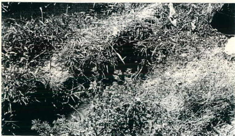
Interconexión canal CONAGUA y derivación del fraccionamiento