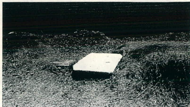
Sección a intervenir dentro del jardín de niños (escuela)