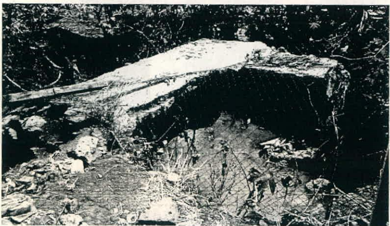
Punto de unión entre colectores principales